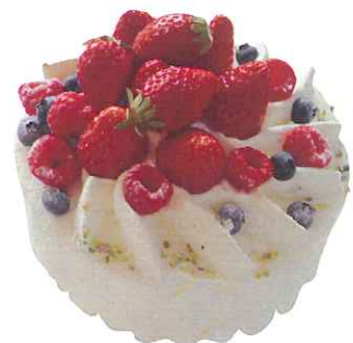
Gateau aux Frelse C ガトーフリーズC

4号 ¥2,400 5号 ¥2,900 6号 ¥3,600 7号 ¥6,500 8号 ¥8,000