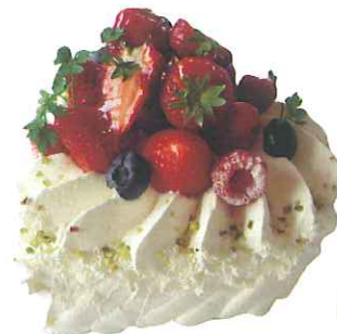
Gateau aux Frelse Heart ガトーハート

4号 ¥2,000 5号 ¥2,500 6号 ¥3,000 7号 ¥5,500 8号 ¥7,000