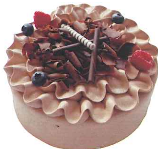
Chocolate Cake A チョコレートA

4号 ¥2,700 5号 ¥3,700 6号 ¥4,200 7号 ¥7,000 8号 ¥9,000