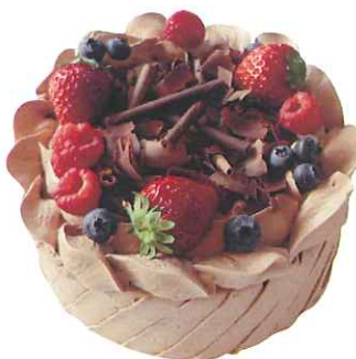
Chocolate Cake B チョコレートB

4号 ¥2,400 5号 ¥2,900 6号 ¥3,600 7号 ¥6,500 8号 ¥8,000