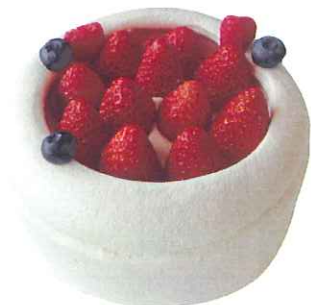
Gateau aux Frelse A ガトーフリーズA

4号 (12cm) 2~3名様 5号 (15cm) 4~6名様 6号 (18cm) 8名様~ 7号 (21cm) 10名様~ 8号 (24cm) 13名様~