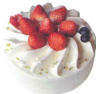
Gateau aux Frelse B ガトーフリーズB